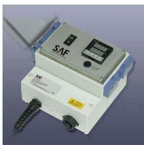
Elektronischer Temperaturregler Serie KM-RD1000