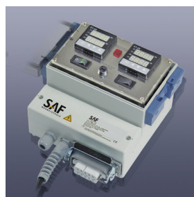
Regler- und Begrenzerkombination KM-RD3000