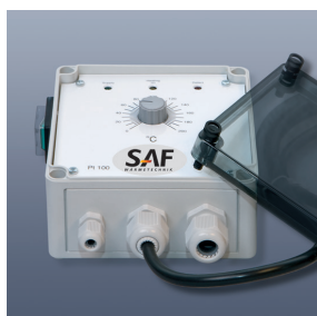
Temperaturregler Serie KM-EC200